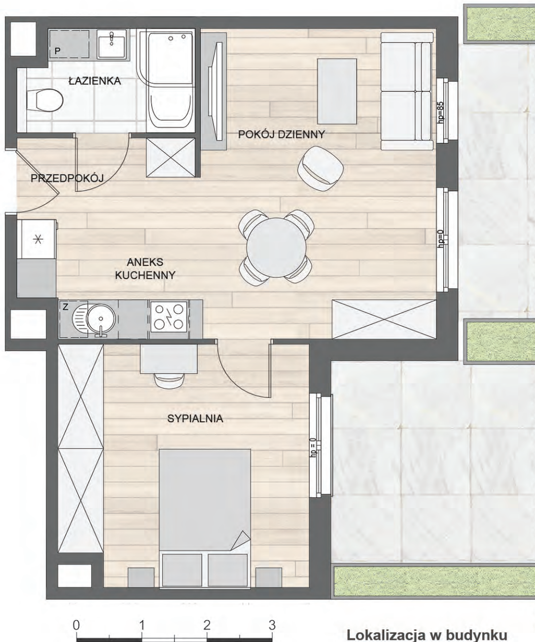
Lokalizacja w budynku

przy ul. Łokietka i ul. Bogusława X w Szczecinie