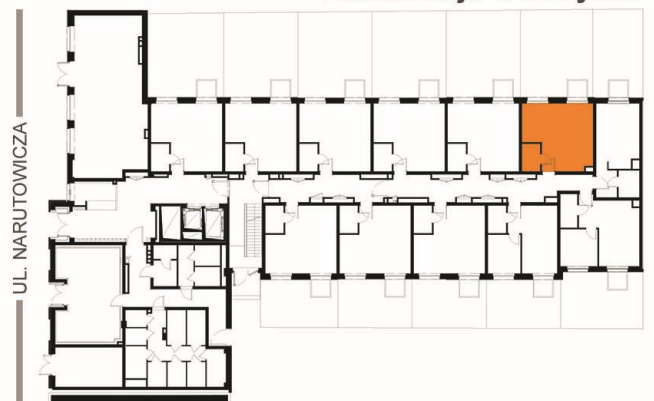
Lokalizacja w budynku