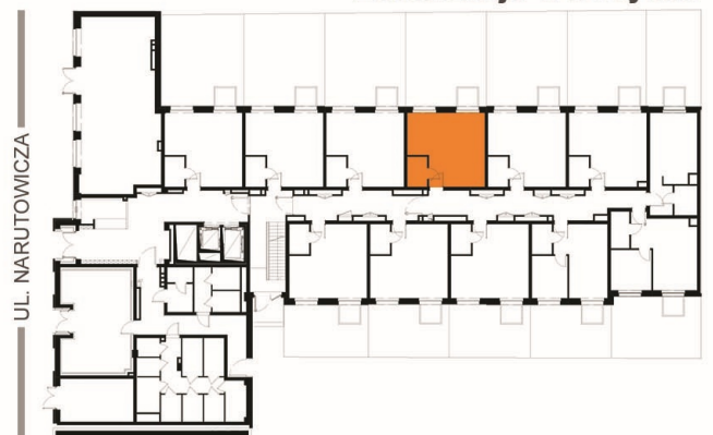
Lokalizacja w budynku